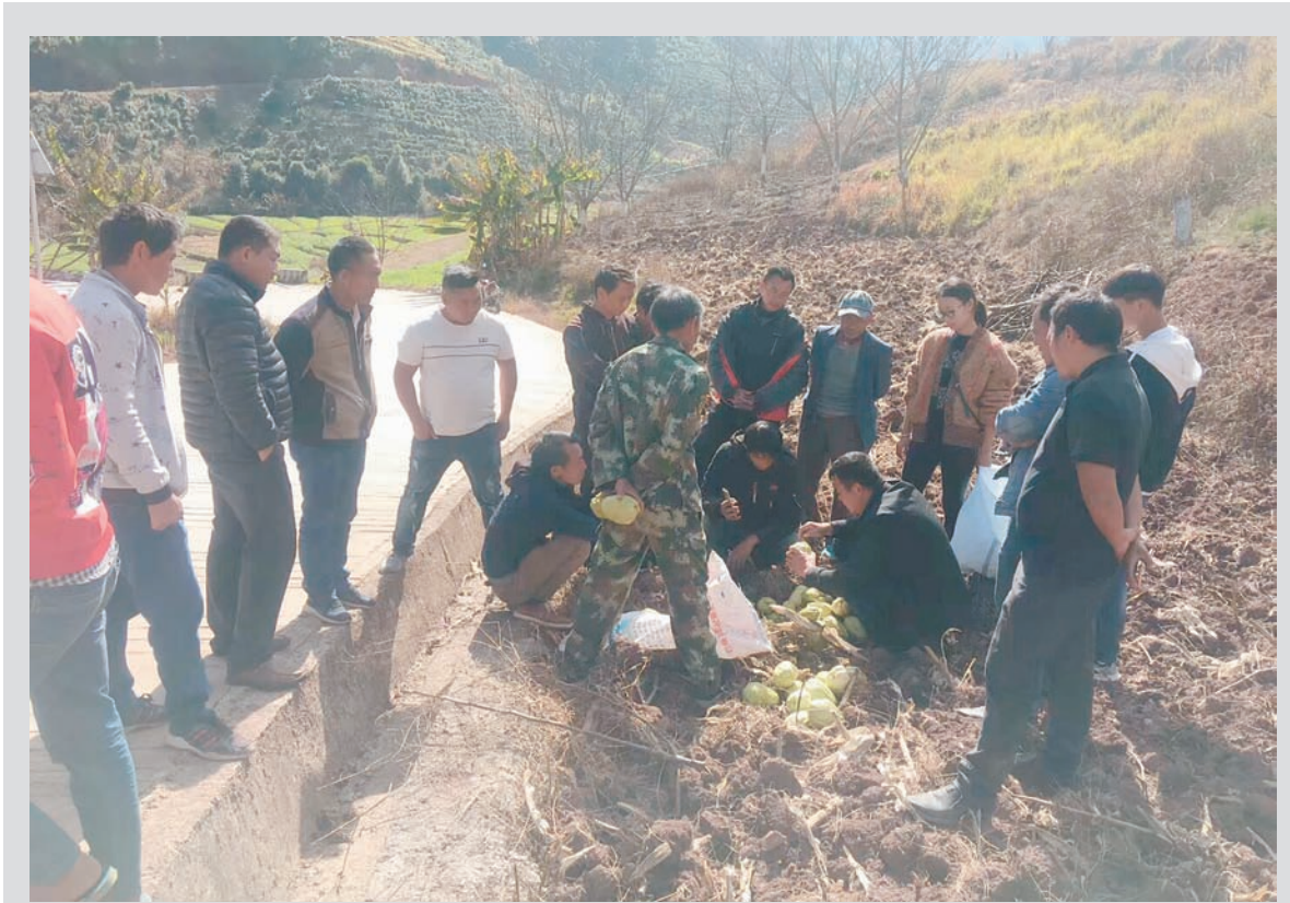
近日,云县忙怀乡麦地村邀请云县荣康农业综合开发有限公司深入该村开展洋瓜(佛手瓜)套袋种植技术培训。技术人员从如何选好瓜种、土壤装袋、规范种植以及科学水肥管理等方面进行示范讲解。

按照山西省政府相关规定,将提高煤层气区块最低勘查投入标准和区块持有成本,企业取得煤层气区块后长期勘查投入不足的将受到处罚,具备开发条件的区块将限期完成产能建设,已进入自然保护区等禁采区的矿业权责令停止开采并有序退出。