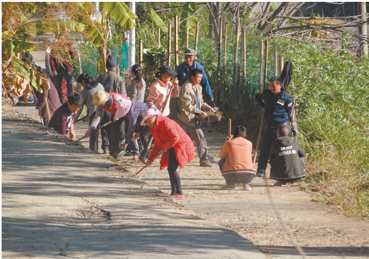
凤庆县洛党镇通过党委带动、支部推动的工作模式,建立健全环境卫生整治长效机制,持续发挥党员先锋模范作用,带领广大群众不断掀起人居环境整治高潮。图为洛党镇组织村民开展村组道路清理。

数据显示,截至2018年底,招商银行零售客户规模已达1.25亿,现在储蓄账户又突破1亿,成为第一家储蓄账户破亿的国内股份制银行。