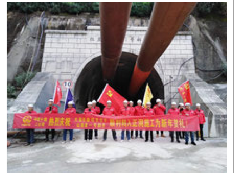
2018年12月31日,位于凤庆县腰街乡境内的中铁十局大临铁路4标段,第一架子队工区承建的红豆山隧道1号斜井顺利转入正洞施工,为元旦献礼。(项目部)