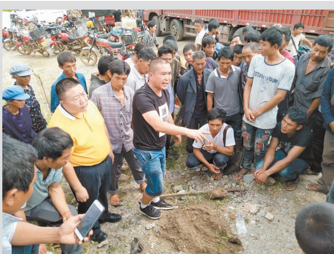
近日,云南久丰农业开发有限公司在云县幸福镇干坡村为6个组186户农户发放花(藤)椒苗,增加贫困户经济收入。在发放现场,公司技术人员和村“两委”干部,认真按照种植到户花名册,进行有序的发苗领苗;公司负责人现场为种植农户培训藤椒苗栽培、嫁接、施肥、中耕管理技术。据了解,该公司在幸福镇干坡村发展规范化种植藤椒基地700亩,采取“公司+基地+农户”发展模式,与种植农户签订种植合同,公司按照市场价回收和保底价每公斤20元回收。

第四批堵点征集活动由国家发展改革委、国务院办公厅、新华社、中国政府网、公安部、自然资源部、住房城乡建设部、交通运输部、人力资源社会保障部等9个部门和单位联合推进。所征集的信息经大数据分析后,选择群众反映最强烈的20个堵点问题,推动有关地方、部门限时解决。